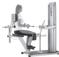
Stabilisation im Sitzen

Erlernen von Kombinationsübungen für Haltungsstabilisierung und Bewegungsmuskulatur.