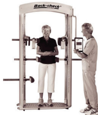
Diagnostik und Verlaufskontrolle mit Back-Check®