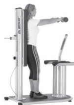
Stabilisation im aufrechten Stand