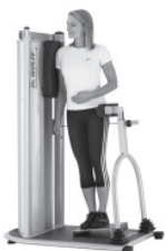
Training der lateralen Rumpf-Muskulatur