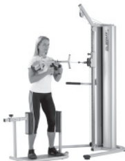
Training der Rotation