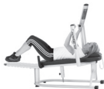
Zielgerichtetes Training des M. transversus